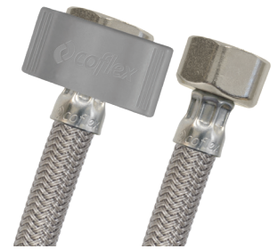
VL-A / VL-A-PL